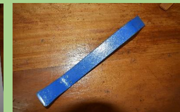
Patasi ya mzinga