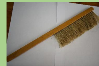
Brashi ya nyuki